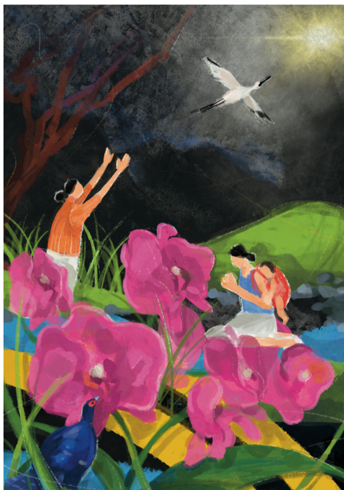
Im Titelbild drückt die junge Künstlerin Hui-Wen HSIAO ihren eigenen christlichen Glauben aus.